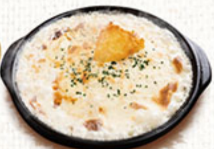
焦がしチーズリゾット