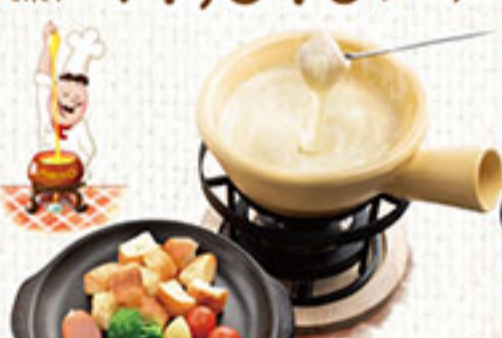
マリ/自慢のチーズフォンデュ