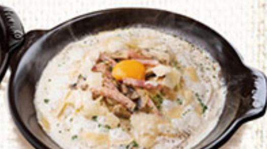
ベーコンマッシュルームのパルメナラ

アレルギー表をご用意しておりますので、お気軽にスタッフへお申しつけ下さい。写真はイメージです。