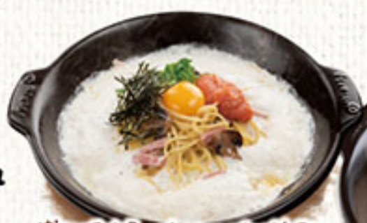
博多明太子とベーコンのパルメナラ