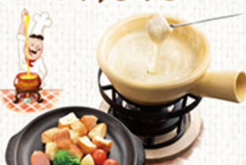
マリ/自慢のチーズフォンデュ