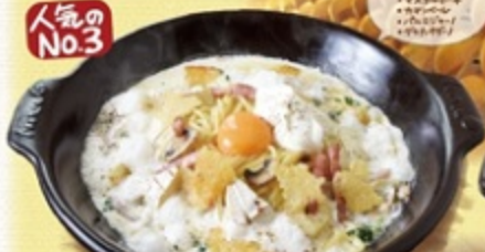
濃厚なチーズとベーコンの贅沢パルメナラ