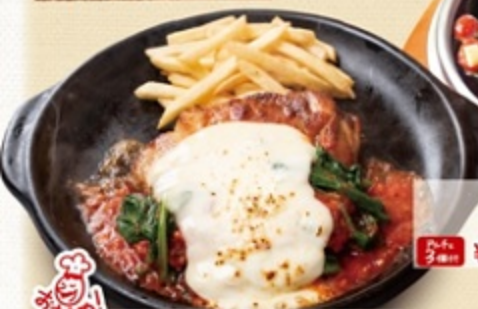
3.ホリトマトのロマーナチキンステーキ