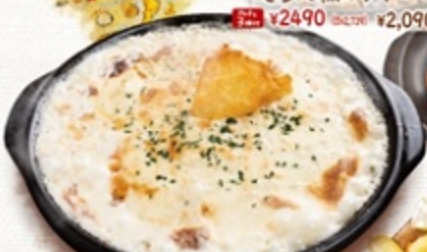
焦がしチーズリゾット