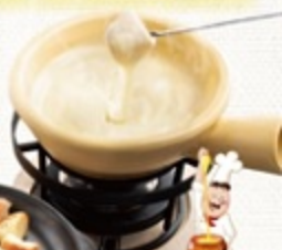
マリ自慢のチーズフォンデュ