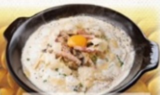
ベーコンマッシュルームのパルメナラ 大人 ¥2590 (税込) 子供 ¥2,190 (税込)