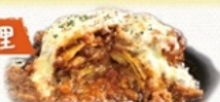
とろと熱々ラザニア