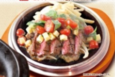
トマトとモzzarellaチーズの 牛赤身ミスジビステッカ(100g)