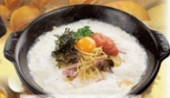
明るい太子とベーコンのパルメナラ