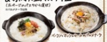
パルメナラ/お皿メナー300円