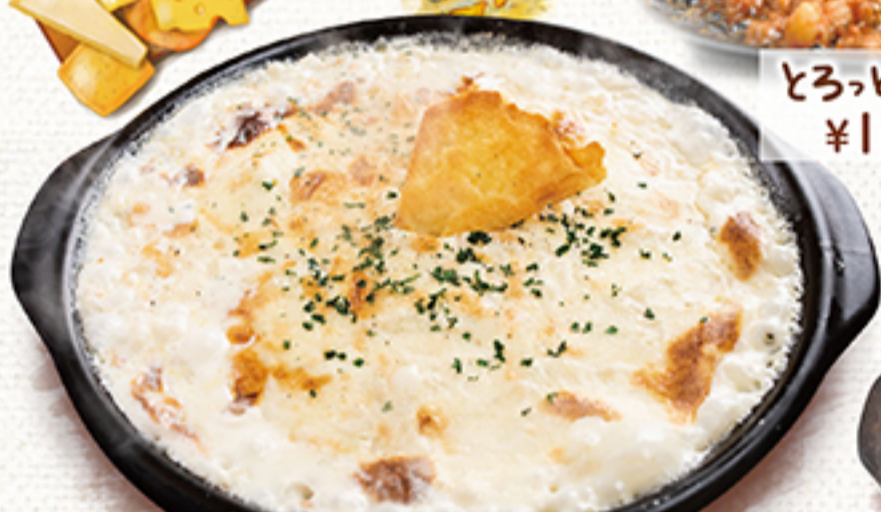
焦がしチーズリゾット ¥1,490 (税別 ¥1,639)