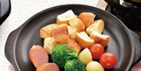
マリ自慢のチーズフォンデュ ¥1,790 (税別 ¥1,969)