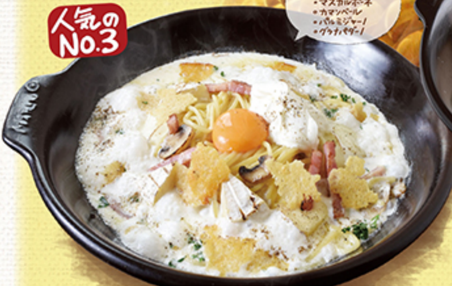
濃厚と種チーズとベーコンの贅沢パルメナ-ラ ¥2,090 (税別 ¥2,299)