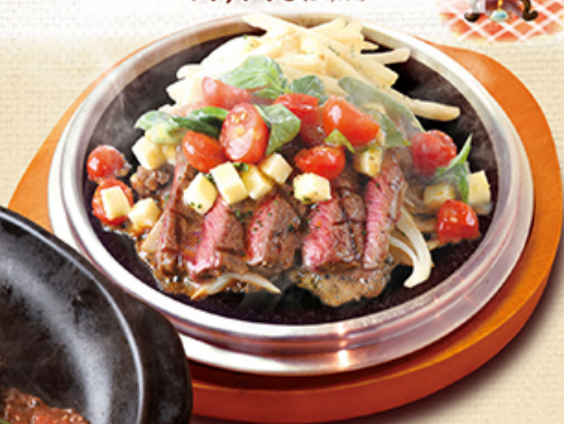
トマトとモッツァレラチーズの 牛赤身ミスジビステッカ (100g) ¥2,090 (税別 ¥2,299)