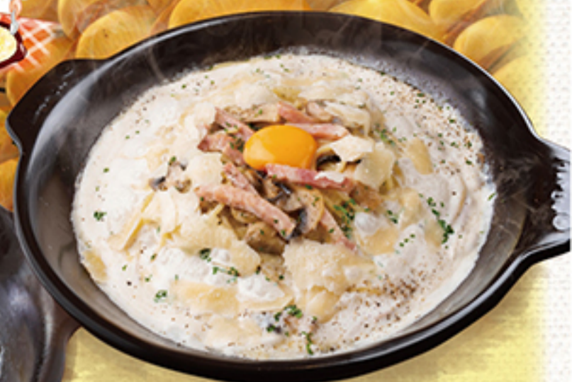
ベーコンとマッシュルームのパルメナ-ラ ¥1,890 (税別 ¥2,079)