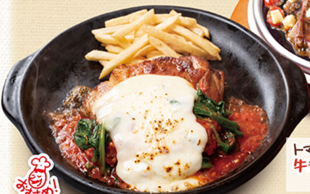
ま.赤トマトのロマーナチキンステーキ ¥1,690 (税別 ¥1,859)