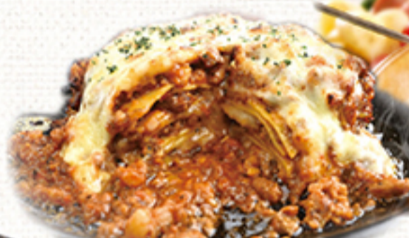
とろっと熱々ラザニア ¥1,790 (税別 ¥1,969)